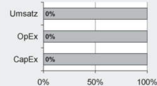
2. Taxonomiekonformität der Investitionen ohne Staatsanleihen*