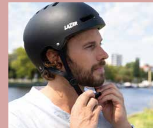
Christian, 36 Jahre