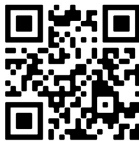
Google Play Store (Android)

Noch schneller an die App gelangen: QR-Code scannen und Download starten.